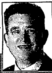
EMILE ROEMER Tweede Kamerlid SP en frequent reiziger op Maaslijn

„We zijn er fel op tegen dat steeds in- en uitcheckt moet worden bij het wisselen van vervoerder. Dat is niet in het belang van de reiziger. En er zal sowieso iets naast de ov-chipkaart moeten komen. Voor buitenlandse reizigers, of voor mensen die zo'n kaart niet willen.”